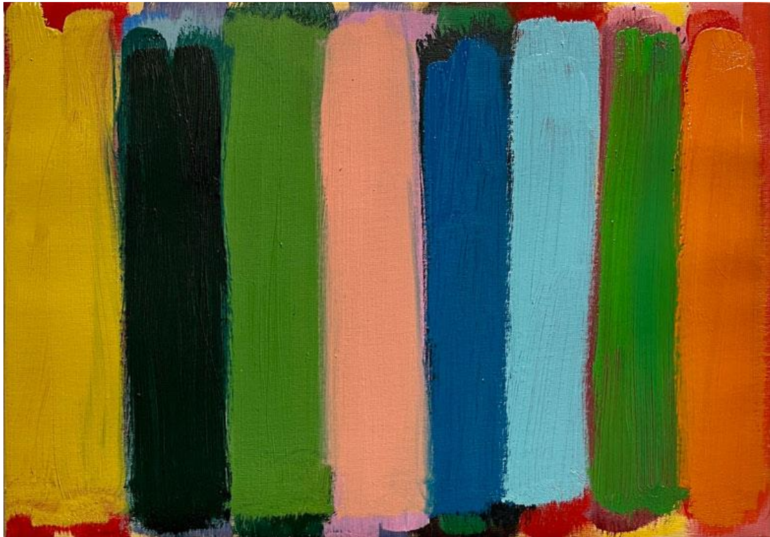
Orange on red, oil on canvas 36 x 51 cm, 2023