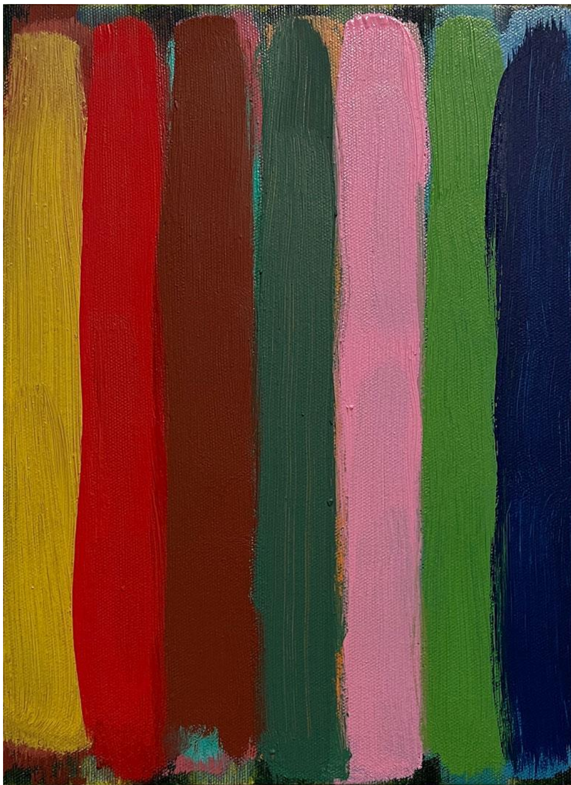
Seven meridians, oil on canvas 36 x 26 cm, 2022