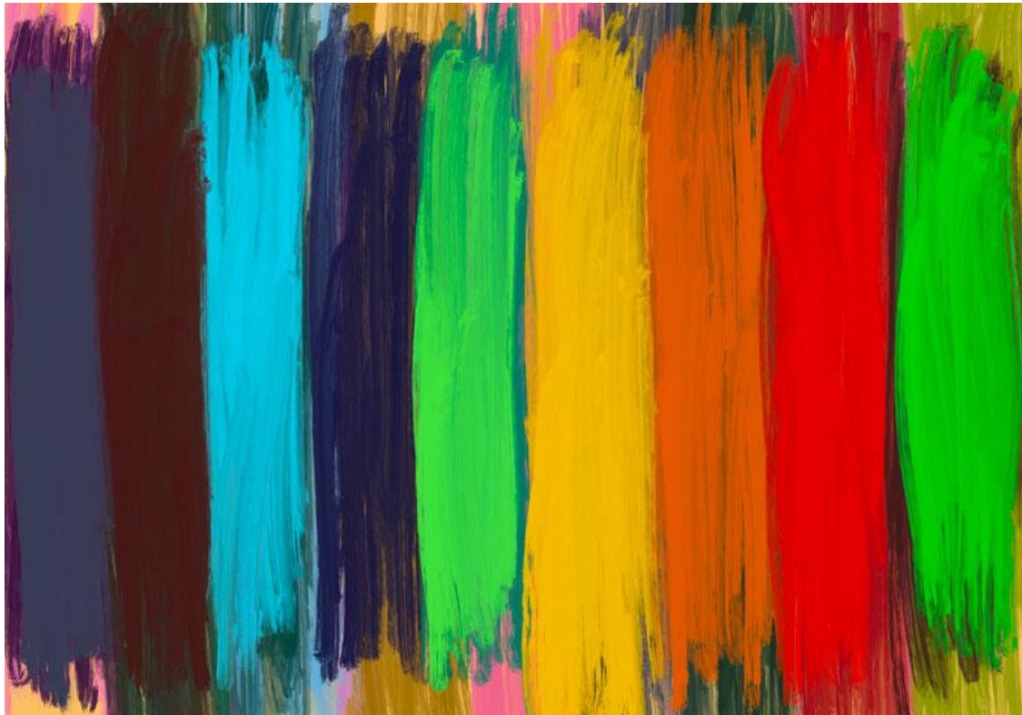
Vertical stripes 02, digital painting 35 x 50 cm, 2023