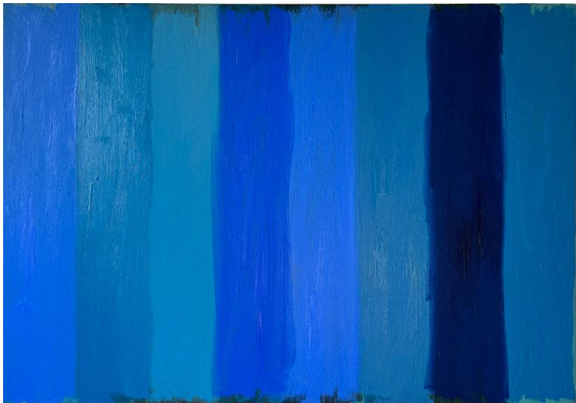
Ocean 02, oil on canvas 90 x 130 cm, 2022