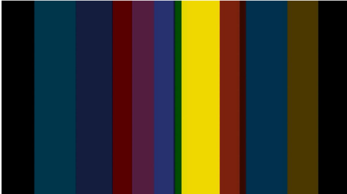
Video number 19, frame, still video, time 00:01, 2023