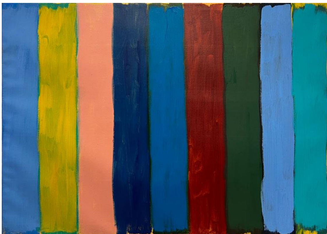
Five blue stripes, oil on canvas 100 x 140 cm, 2023