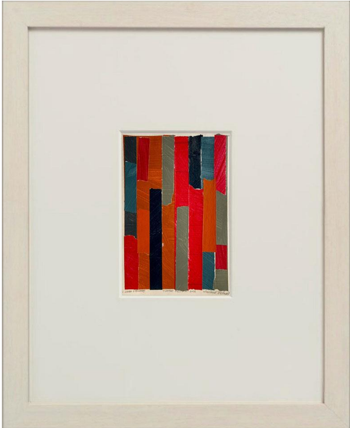
Broken stripes, acrylic on paper, collage on paper, 18 x 12 cm, 2022