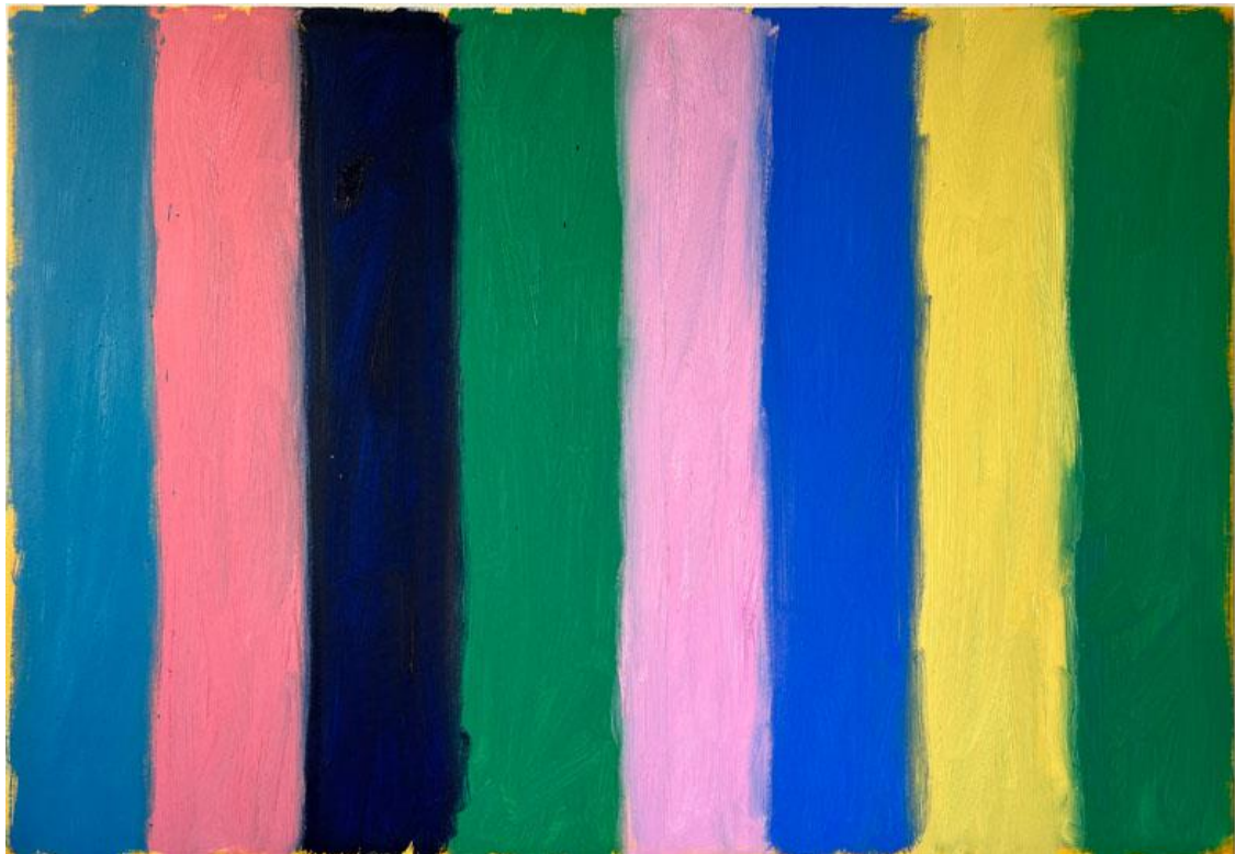
Summer painting, oil on canvas 90 x 130 cm, 2022