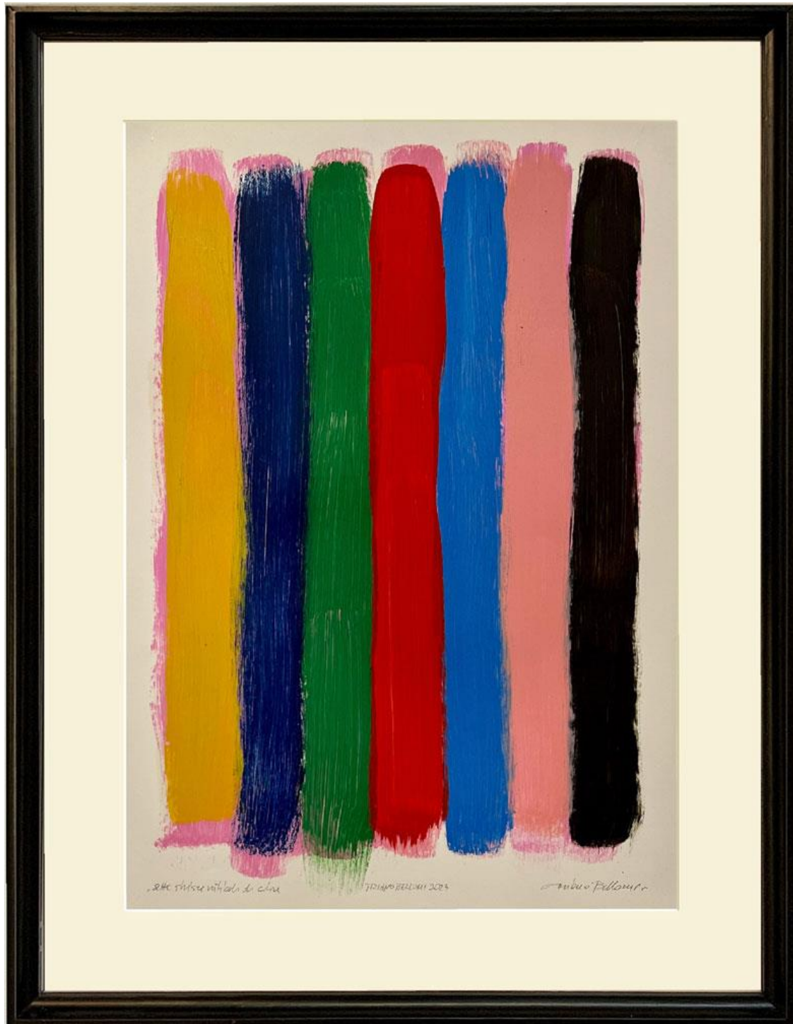
Seven colored stripes, oil on paper 49 x 34 cm, 2023