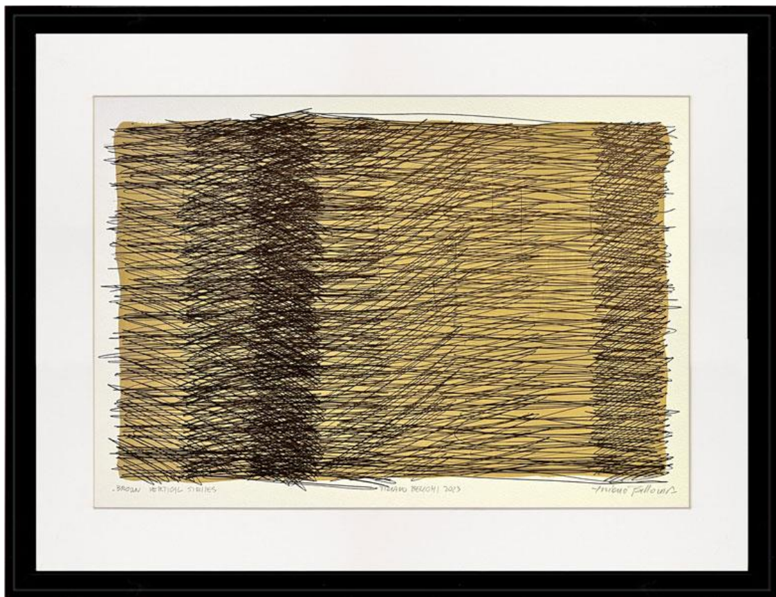
Brown drawing, acrylic and black ballpoint pen, paper size 29,7 x 42 cm, 2023