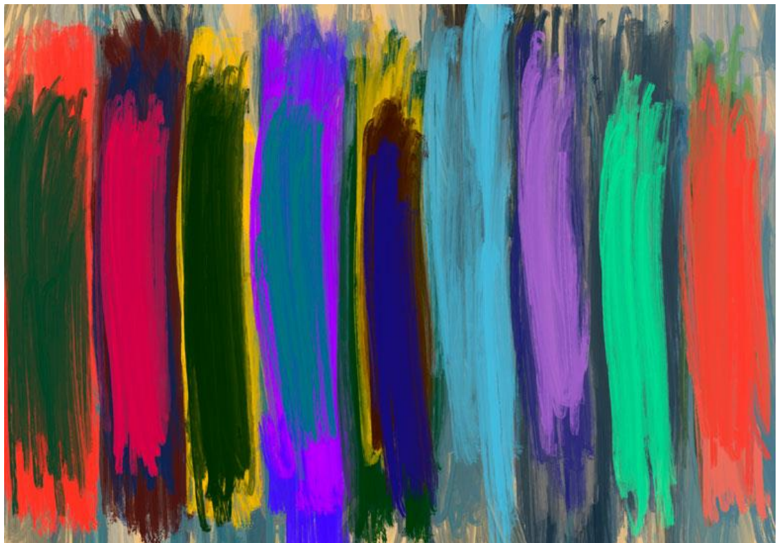
Vertical stripes 01, Digital painting 35 x 50 cm, 2023