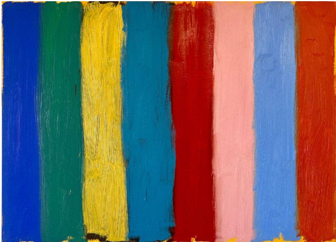
Colors of summer, oil on canvas 65 x 90 cm, 2022