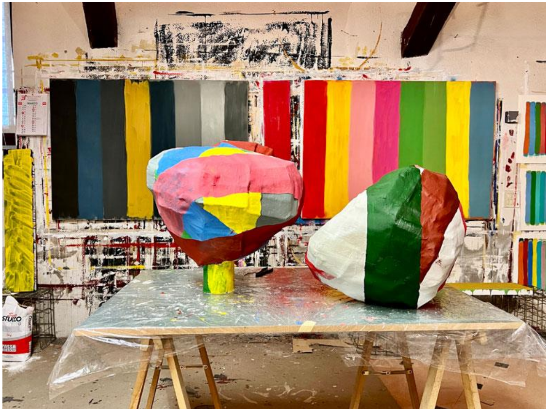
Sculptures and paintings in the studio, via del Bersagliere 8/E Verona, Italy, 2023