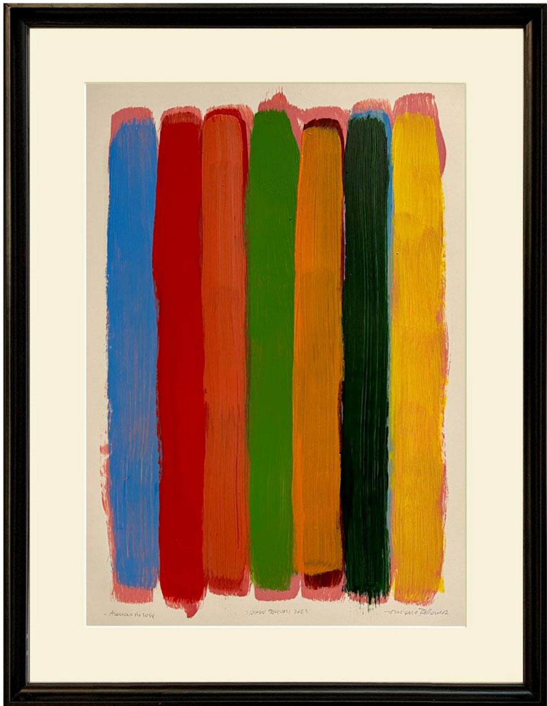
Orange on pink, oil on paper 49 x 34 cm, 2023