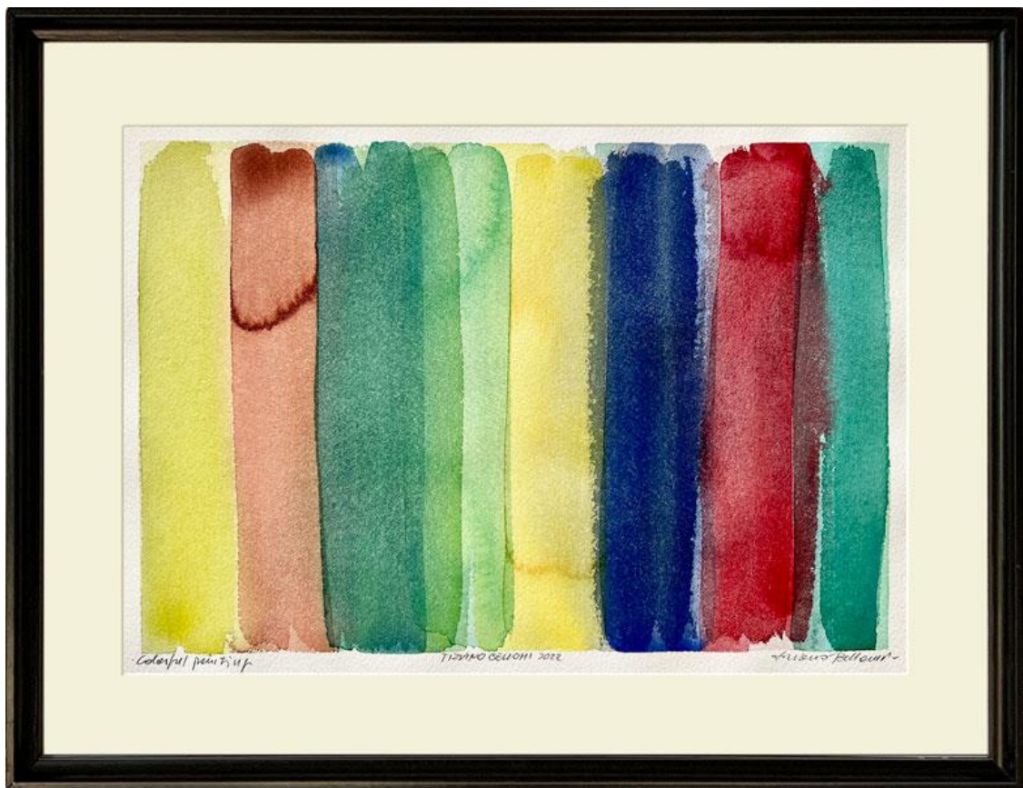
Colorful painting, watercolor, 26 x 36 cm, 2022