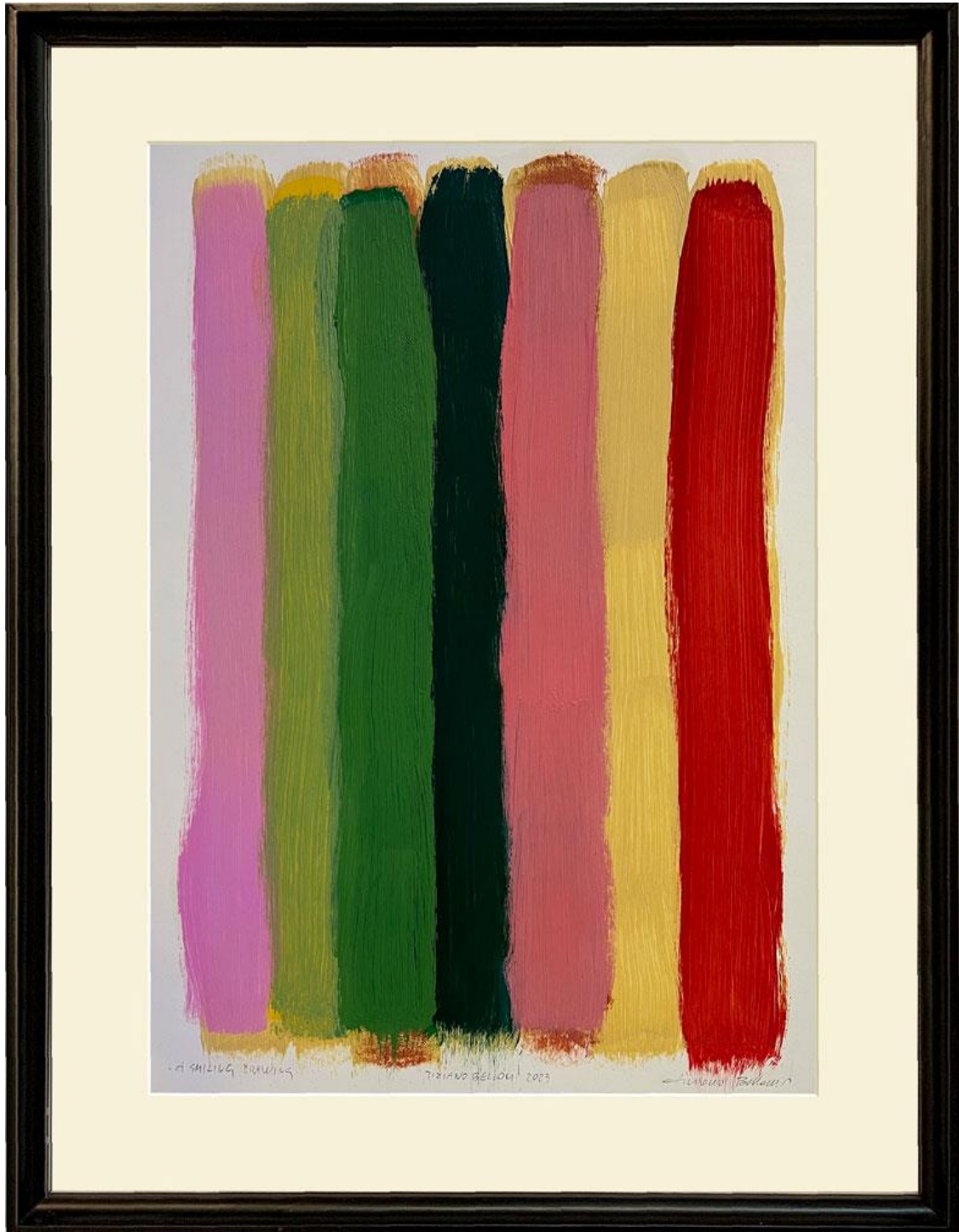
A smiling drawing, oil on paper 49 x 34 cm, 2023